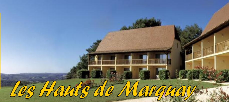
Les Hauts de Marquay

Du samedi 20 mai au vendredi 26 mai 2023